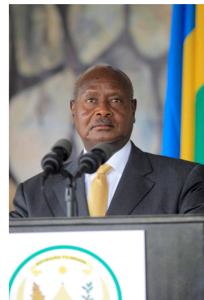
Ugandische Präsident Yoweri Museveni